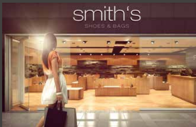
Horizontal-Schiebe-Wand-Systeme Horizontal Sliding Wall Systems