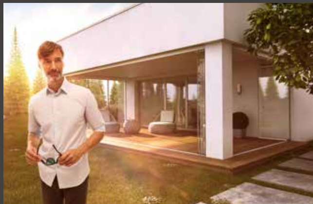
Schiebe-Dreh-Systeme Slide and Turn Systems