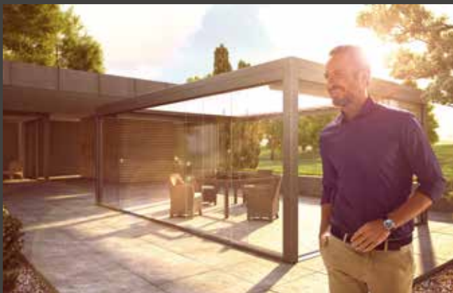
Schiebe-Systeme Sliding Systems